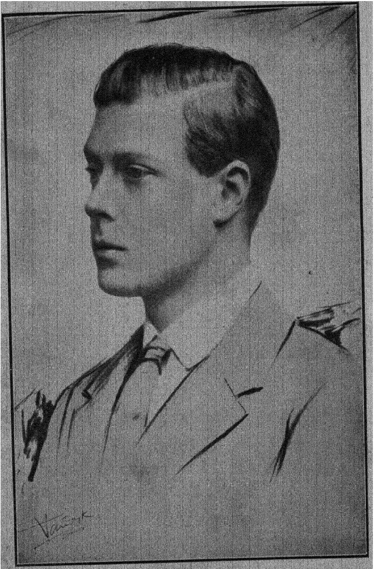
बादशाहा आठवे एडवर्ड